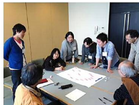
ワークショップ風景

創立 25 年の節目にあたり、社員ひとりひとりの思いを掘り起し、新たな仕事のあり方を見出すことを目的としました。まず、ショクバで起きている問題点の連鎖を発見し、各自が自律的に解消策を考えました。更に、ひとりひとりの強みを共有化し、その強みを活かした働き方を全員で構築しました。それに基づいて、みんなが自分らしく働くための共通理解を深めて、今後の行動規範となる「熱海ルール」を設定しました。