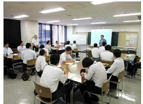
ワークショップ風景

地域の公共事業に関わる設計や調査を行う創立 55 年の歴史ある会社です。近年の公共事業の環境変化に対する課題として、社員の意識改革を掲げました。まず、日常的な行動や発想に潜んでいる「思い込み」に気づき、チームごとの関係性を向上するための課題を抽出しました。次に、ひとりひとりの強みをチーム毎に共有し、それを活かす働き方、また各自の意識が前向きになる「快」の働き方を検討し共有しました。さらに、チーム内だけに留まらず、シヨクバ全体の環境を「快」にする方策も提案しました。